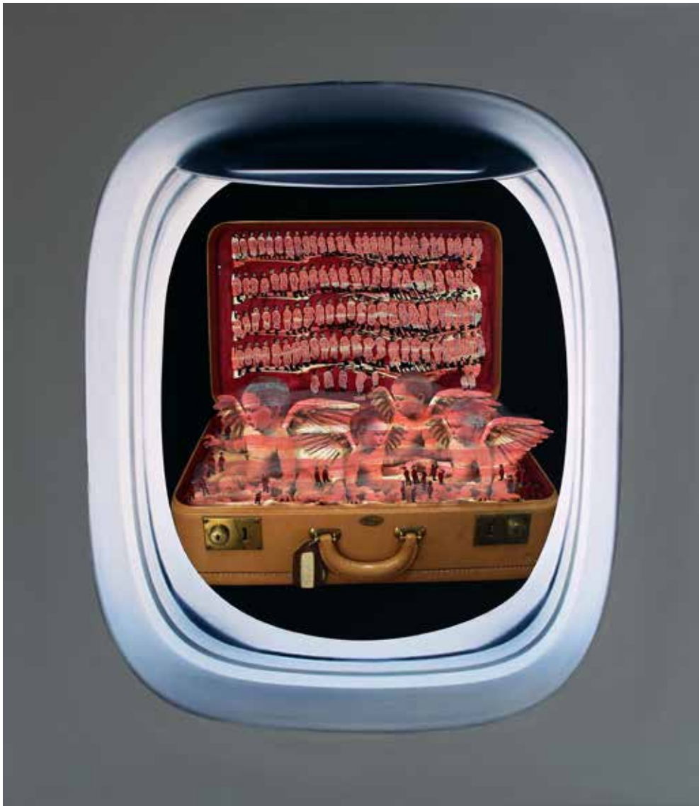
Wandering IO 2014 Mixed Media on Canvas. 65 x 75 cm