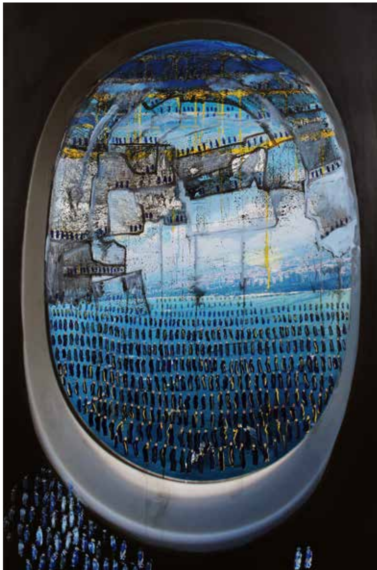
Wandering 4 2014 Mixed Media on Canvas. 87 x 132 cm