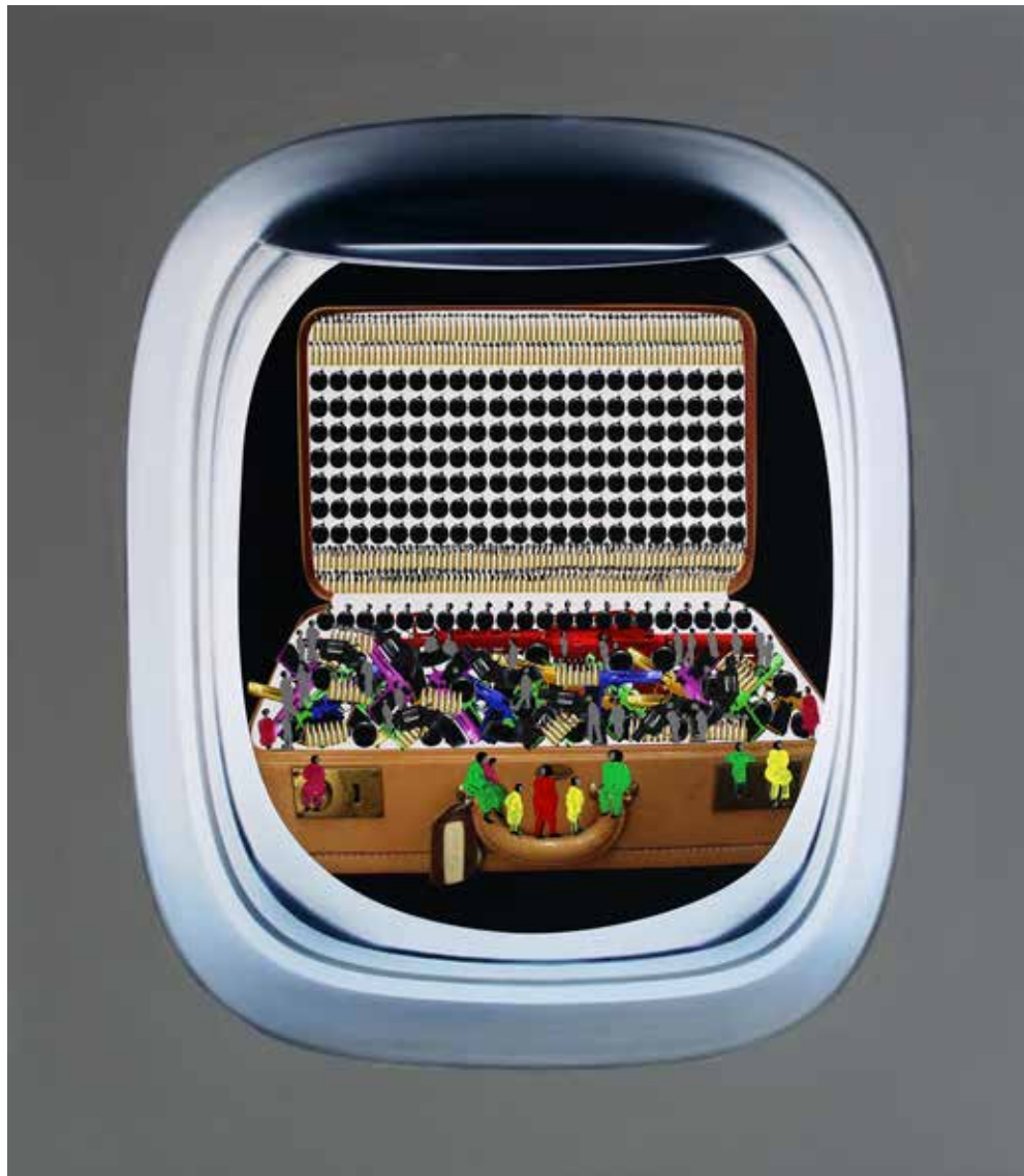
Wandering 8 2014 Mixed Media on Canvas. 65 x 75 cm