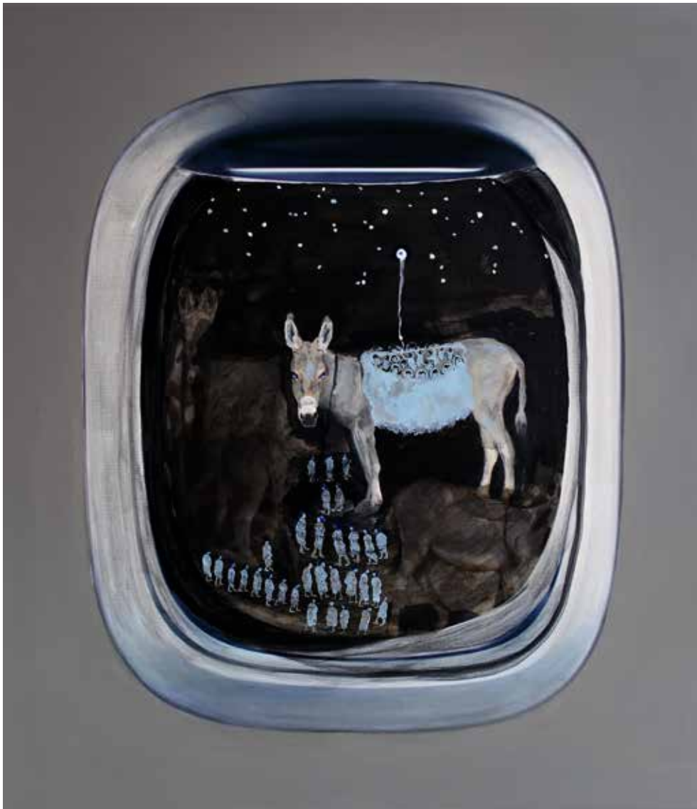
Wandering 7 2014 Mixed Media on Canvas. 65 x 75 cm