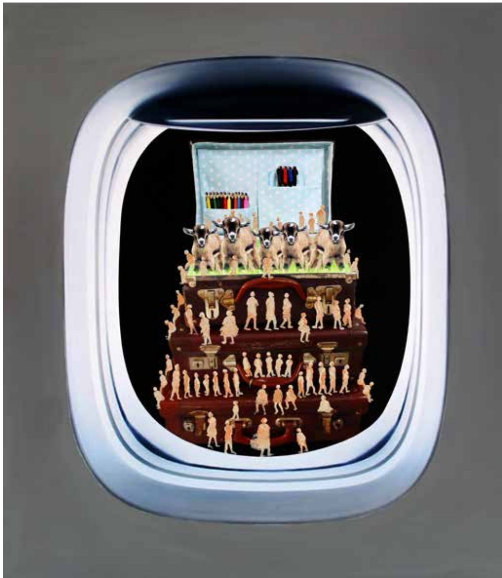
Wandering 6 2014 Mixed Media on Canvas. 65 x 75 cm